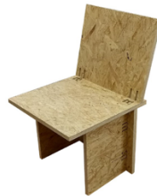
Exemple de réalisation