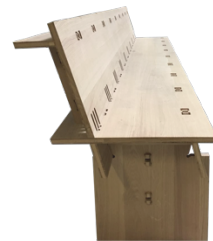
Prototype de banc