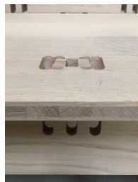
Détail d'un joint